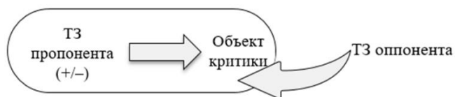
Рисунок 2. Точка зрения по отношению к объекту критики в реактивной критике

Установлено, что точка зрения в дескриптивной критике – это мнение, фиксирующее отрицательное отношение субъекта к объекту критики. Объект дескриптивной критики – это то, что подвергается анализу, оценке или осуждению. Точка зрения в реактивной критике – это мнение, фиксирующее отрицательное отношение субъекта-оппонента к объекту критики. Объектом реактивной критики является точка зрения пропонента, выраженная вербально и представляющая собой спектр возможных речевых действий от триггерного высказывания до развернутой аргументации.