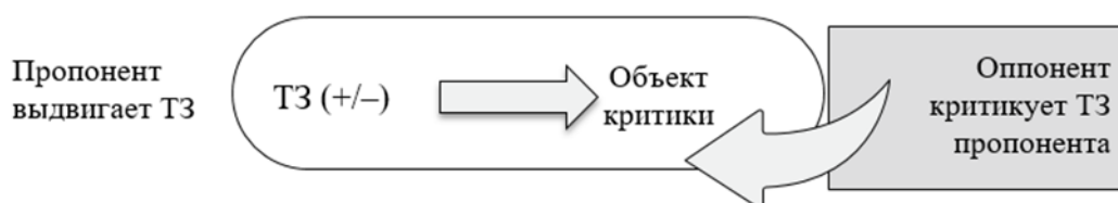
Рисунок 5. Схема реактивной критики

Реактивная критика представляет собой обратную связь в отношении существующей аргументации (см. рис.5).