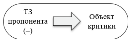
Рисунок 1. Точка зрения по отношению к объекту в дескриптивной критике

В разделе 3.3. описывается понятие «точка зрения», являющееся продуктивным способом структурирования позиций участников коммуникативной ситуации и рассматриваемое в данной работе в качестве некоторой системы координат для установления направления критики, исходящей от оппонента / пропонента отрицательной оценки (рис. 1 и 2).